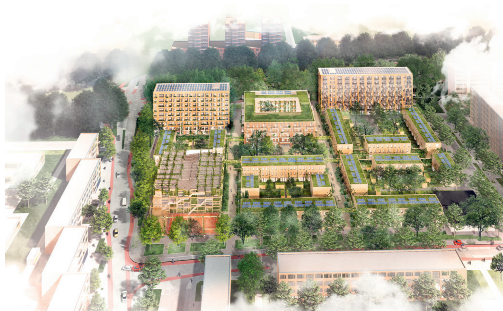
Het definitieve ontwerp van de Ivoordreef. (Aan deze afbeelding kunt u geen rechten ontleen.)

Links: De panelen worden opnieuw gebruikt. Dus die worden voorzichtig gedemonteerd en van de flat gehesen. Beneden staan ze netjes bij elkaar.