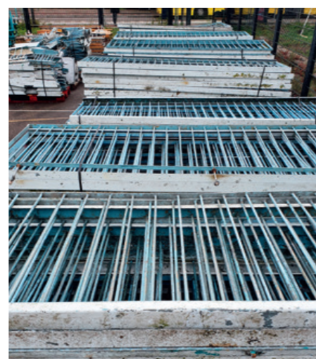
De galerijhekken krijgen een plek in de nieuwe woningen.